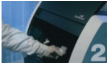
Dentallabor scannt das Arbeitsmodell