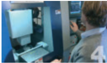
Biodenta CAM-Partner fräst/fertigt die Restauration mit der Fräsmaschine (Biodenta CAM Multi Axis)