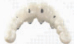
CAD / CAM