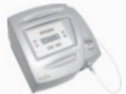
Dentaler Dioden Laser

Das Produktportfolio der Biodenta Swiss AG mit Sitz in Berneck umfasst Zahnimplantate, Diodenlaser sowie den gesamten CAD/CAM Bereich von computergestützter chirurgischer Planungshilfe für Zahnärzte über individualisierte Prothetik bis hin zu komplexen Implantatbrücken.