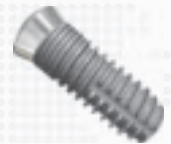
Dentales Implantat System