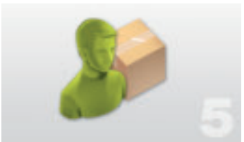
Dentallabor versendet die gefertigte Restauration

Biodenta steht für höchste Schweizer Qualität und Präzision. Spezialisten innerhalb und ausserhalb Biodenta werden täglich gefordert, Produkte und Lösungen in den Bereichen Innovation, Design, Zuverlässigkeit und Einfachheit zu verbessern.