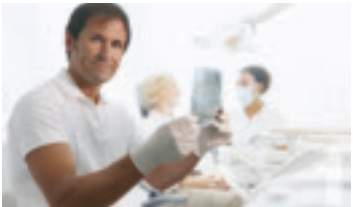
Zahnarzt oder Zahntechniker benötigt Restauration aus Zirkon oder Titan

Biodenta ist bestrebt, die verschiedenen Themen rund um den Zahn miteinander zu verbinden und so den Arbeitsalltag von Zahnärzten und Dentaltechnikern stetig zu erleichtern, beziehungsweise zu optimieren und die Qualität für deren Kunden zu steigern.